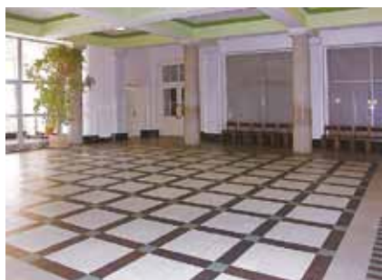
Přijímné prostředí historických prostor školy