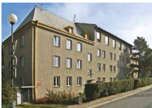
Odloučené pracoviště pro výuku oboru Podnikání