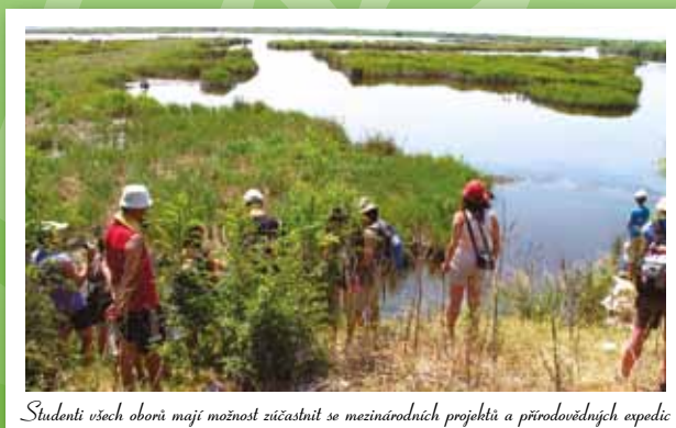
Studenti všech oborů mají možnost zúčastnit se mezinárodních projektů a přírodovědných expedic