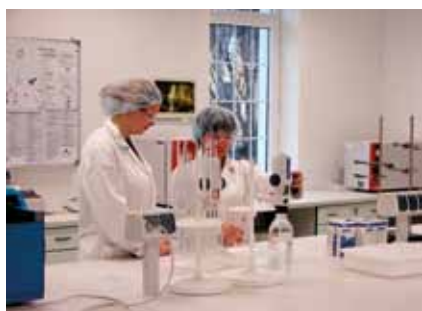
Moderní praxe v laboratorních podmínkách Training centra TEVY