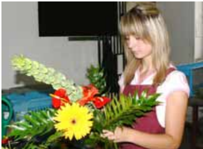
Výuka vazačství a aranžování v květinových síních

Žáci se naučí zvládat práce ve všech zahradnických oborech, dokážou množit, vysazovat, ošetřovat či hnojit zahradnické rostliny ve sklenících i na volné půdě, realizovat sadové úpravy, zhotovit běžné vazačské výrobky a mnoho dalších dovedností využitelných ve všech typech zahradnických komplexů.