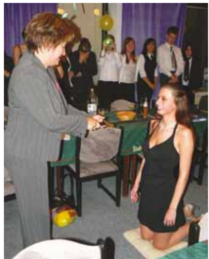
Stužkování maturantů školy - ukončování studia