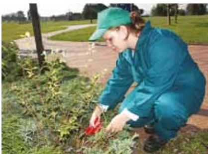
Projektování, údržby, realizace zahrad, parků