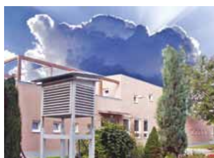
Nabízíme výuku v nadstandardních prostorách

Po ukončení oboru je možné navázat na další studium na VOŠ v naší škole v programu „Regionální politika zemědělství a venkova“.