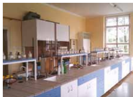
Vlastní chemická laboratoř přímo ve škole