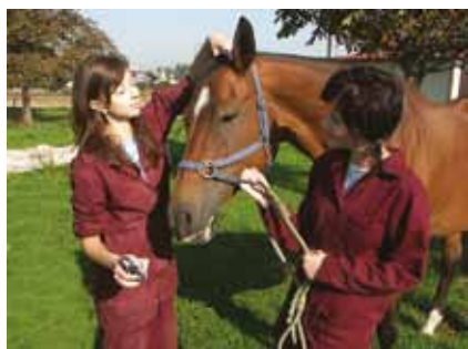
Moderně pojata odborná praxe

Pokračovat se dá i na kterékoliv vysoké škole, a to nejen zemědělského zaměření.