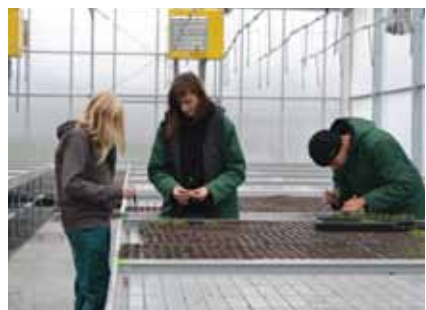
Odborná výuka na pracovních stoly i partnerských podnikcích

MATURITA NA NAŠÍ ŠKOLE - po úspěšném absolvování studia nabízíme možnost pokračovat na naší škole ve studiu v rámci dvouletého nástavbového studia oboru Podnikání, které je zakončeno maturitní zkouškou.