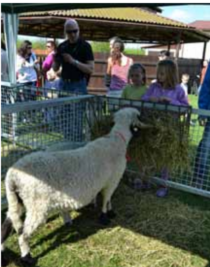
Oslovení zájemců o studium - Akce školy pro veřejnost

Tříleté pomaturitní studium zakončené absolutoriem a získáním titulu DiS. Moderně koncipovaný obor dle požadavků Evropské unie.