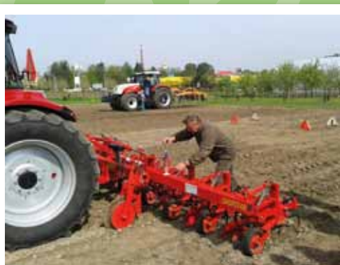
Studenti se učí pracovat s širokou škálou zemědělské techniky