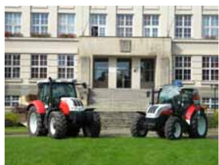
Praxe na moderní technice

MATURITA NA NAŠÍ ŠKOLE - po úspěšném absolvování tříletého studia nabízíme možnost pokračovat na naší škole ve studiu v rámci dvouletého nástavbového studia oboru Podnikání, které je zakončeno maturitní zkouškou.