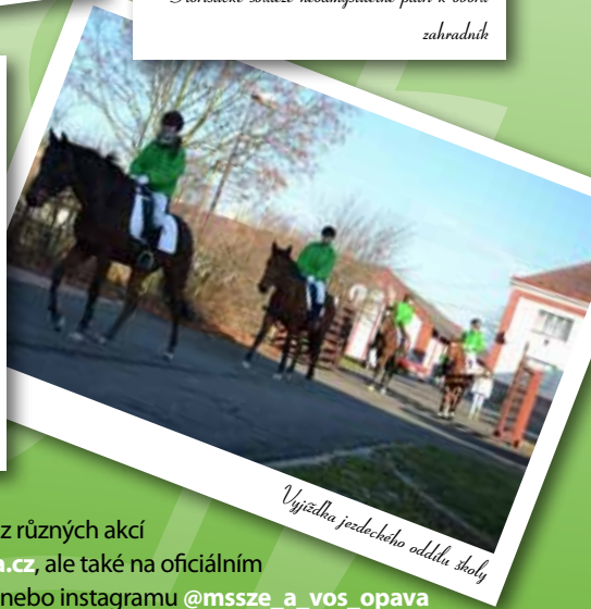
Výjezdka jezdeckého oddělu školy

Veškeré informace o naší škole včetně fotek a videí z různých akcí naleznete nejen na webu www.zemedelka-opava.cz , ale také na oficiálním facebooku školy www.fb.com/zemedelka.opava nebo instagramu @mssze_a_vos_opava