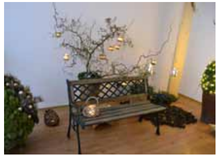
Školní výstava pro širokou veřejnost v nové vystavovacích prostorách pro praxi