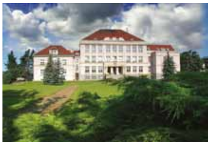
Pohled na hlavní budovu